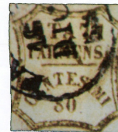
16 dicembre 1859 (Il corriere filatelico 11, 1937; 1919)