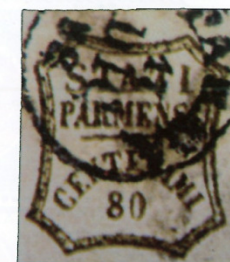
17 dicembre 1859 (Il corriere filatelico 5, 1934)