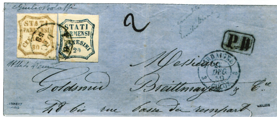
17 dicembre 1859 (Filatelia 37, 1966; 1899)

un'indagine certosina rintracciando tutti gli esemplari, proposti ora per la prima volta in un ensemble inedito, corredati dalla data dell'annullo, dal riferimento bibliografico della prima segnalazione fotografica e dall'anno della prima citazione documenta.