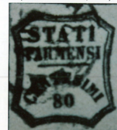
29 novembre 1859, (G. Pietrucci, I bolli di annullamento, Ferri, Roma 1954; 1947)

Poste Italiane spa - sped. A.P. - d.l. 353/2003 art. 1, cm. 1, DCB TO n. 10 ottobre 2013 (1028) - mensile - € 5,50