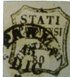
15 dicembre 1859 (Il corriere filatelico 3, 1937; 1935)