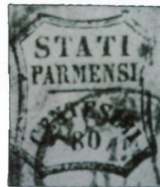
15 dicembre 1859 (Il corriere filatelico 11, 1937; 1903)