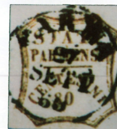
27 settembre 1859 (Vaccari Magazine 32, 2004; 1984)