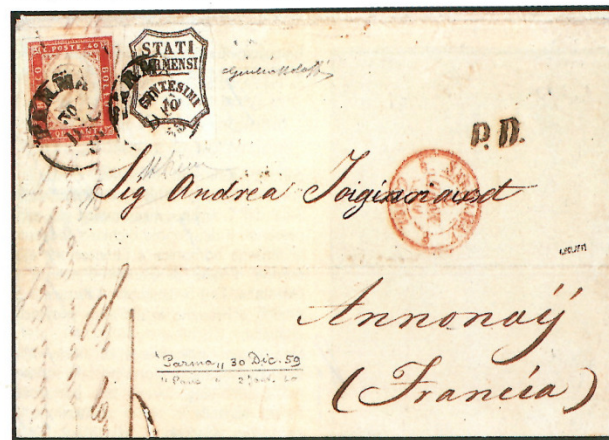
Lettera da Parma, 30 dicembre 1859, ad Ammonay, con il 40 c. di Sardegna in affrancatura mista con un 10 c. del Governo Provvisorio di Parma.

con la direzione generale delle poste sarde. Ancora una trasferta di guerra per la IV emissione di Sardegna! I Piemontesi intanto avevano già in mano l'Oltrepennino modenese e la Lunigiana, dove era stato autorizzato l'uso dei francobolli sardi, nonostante le aspre critiche francesi, non rientrando negli accordi di Villafranca le annessioni di fatto operate dal Piemonte.