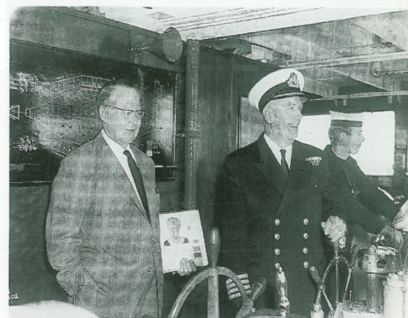
Robson Lowe sul ponte della "Queen Mary" con il comandante della più famosa nave della flotta britannica.

La data del 7 gennaio potrebbe forse essere proposta ai filatelisti di tutto il mondo come giorno da festeggiare. In tale giorno infatti è nato Robson Lowe, a tutti noto come "Robbie" l'uomo che più di ogni altro ha contribuito allo sviluppo della filatelia.