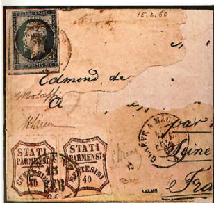
Frammento di lettera da Piacenza, 13 febbraio 1860, diretta in Francia, con due esemplari del 40 c. rosso mattone del Governo Provvisorio di Parma, in affrancatura mista con un 20 c. di Francia.

Stati Parmensi e cifre racchiuse in cornice ottagonale, previa scappellatura negli stereotipi del vecchio valore e inserimento del nuovo in caratteri mobili. La circolare del 27 agosto autorizzò la stampa in fogli di sessanta esemplari su carta a macchina, bianca non filigranata, senza dentellatura, in cinque colori diversi: verde per il 5 centesimi, bruno per il 10, azzurro per il 20, rosso mattone per il 40, bistro oliva per l'80. L'inchostro, usato in modo discontinuo, ha dato origine a diverse varietà di colore, mentre altre varietà derivano da difetti dei ri-