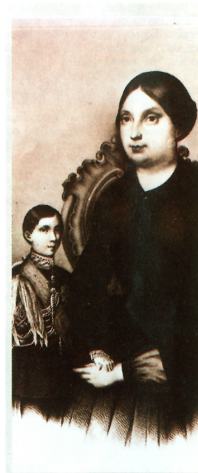
Maria Luisa di Borbone, ultima duchessa di Parma.