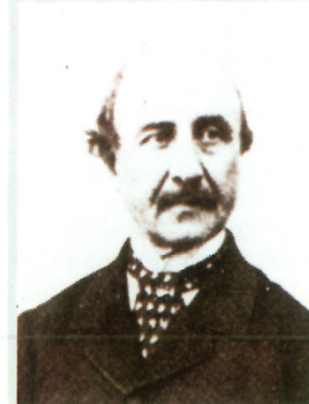
Luigi Carlo Farini, dittatore dell'Emilia, fu il principale artefice del plebiscito che sancì l'annessione di questa regione al Regno di Sardegna.