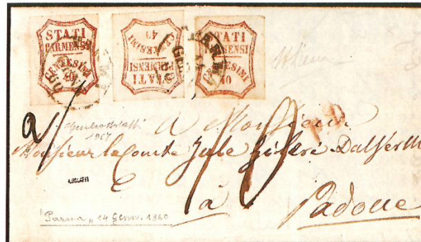
Lettera da Parma, 14 gennaio 1860, a Padova, con tre esemplari del 40 c. vermiglio chiaro; è un'affrancatura molto rara.