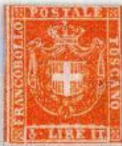
3 lire nuovo offerto in incanto Bolaffi del 1991, collezione "Pedemonte".

sul loro reale numero, vuol dire anche raccogliere aneddoti riguardanti i grandi filatelisti che li hanno collezionati. Tempo fa mi aveva incuriosito la presentazione di un 3 lire nuovo in perfette condizioni offerto all'asta Pedemonte (Bolaffi 1991). Questo lotto riportava la descrizione delle splendide condizioni di conservazione dell'esemplare, una breve considerazione sull'esiguo numero dei 3 Lire e in conclusione un commento: "Non esistono coppie: nella collezione Ferrari esisteva una striscia di 3 Lire nuovi, che fu però a suo tempo tagliata". Di questo commento ne parlai con alcuni esperti e infine Giangiacomo Orlandini mi consigliò di contattare Giorgio Colla. Il noto esperto filatelico di Torino mi inviò un eccezionale documento fotografico e una breve nota in cui mi specificava che suo nonno, il famoso esperto e commerciante filatelico Evasio Asinelli, aveva acquisito un coppia del 3 lire nel 1923 insieme ad altre gemme filateliche appartenute ad Achillito Chiesa, ritenuto da molti