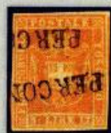
3 lire con timbro "per consegna", asta Bolaffi del 18/19 maggio 2007.

3 lire Caspary con timbro lineare "Per consegna", battuto il 21 ottobre 2006 da Investphila.