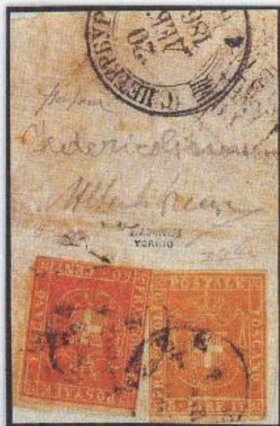
3 lire su frammento: da Firenze a San Pietroburgo.

Come riportato nell'introduzione, la filatelia, anche quella osservata sui documenti fotografici, ha il potere di far galoppare la fantasia, e nel caso della coppia dei 3 lire di Achillito Chiesa non si può fare a meno di fantasticare sul valore che avrebbe questo multiplo oggi sul mercato filatelico. Sarebbe l'uni-