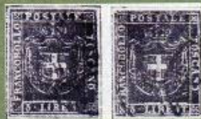
Qui le immagini dei due 3 lire, il buono e il falso.

Una di tali imitazioni che poco tempo fa giungeva ad un noto collezionista, gli era stata offerta ed inviata da Parigi. L'insieme del disegno è riuscito abbastanza fedelmente, ma la dicitura inferiore differisce notevolmente; le lettere hanno linee più marcate e più dritte, e se a ciò si pone attenzione, non sarà molto difficile riconoscere l'imitazione anche per l'impasto del colore del fondo, che è troppo uniforme. L'altra imitazione, molto più pericolosa, ci è giunta in questi ultimi giorni dalla Svizzera. Anche per questo esemplare si è messa a partito la carta filigranata di un altro valore della serie. La stampa è uniforme, e come complesso il francobollo non è tale da suscitare sulle prime alcun sospetto (vedasi riproduzione ingrandita) specialmente perché il punto di colore è quasi esattamente riprodotto. Ma un esame attento mostrerà alcune inesattezze nella conformazione delle lettere della dicitura; le linee bianche che segnano la base della corona sovrapposta allo scudo, sono disposte in modo alquanto diverso. La cifra "3", che è come rattrappita nell'originale, è invece meglio formata e meno chiusa nell'imitazione. L'attenzione prudente del compratore di tale rarità dev'essere tanto maggiore in quanto la presenza dell'annullamento originale a data (Livorno) contribuisce a rimuovere ogni sospetto.