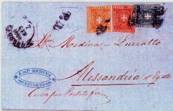
3 lire "Faruk": da Livorno ad Alessandria d'Egitto, il 7 gennaio 1860.