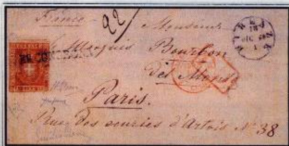
3 lire "Rothschild": raccomandata da Firenze a Parigi il 18 dicembre 1860.

Quando si decise il cambio dei francobolli e del sistema monetario toscano (in vero complicato: 60 quattrini = 20 soldi = 12 crazie = 1 lira toscana = 0,84 lire italiane) era già la fine del 1859. Il barone di ferro Bertino Ricasoli, Presidente del consiglio del Governo di Toscana, fece emanare la legge 28.11.1859 che all'articolo 28 specificava i sette valori della serie: centesimi 1, 5, 10, 20, 40, 80 e 3 lire con i rispettivi colori. Le poste