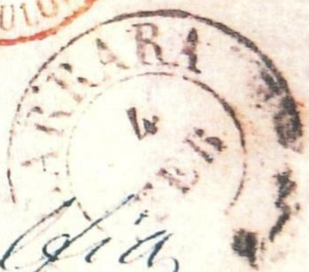
Carrara 4 febbraio 1858 CERT. DIENA