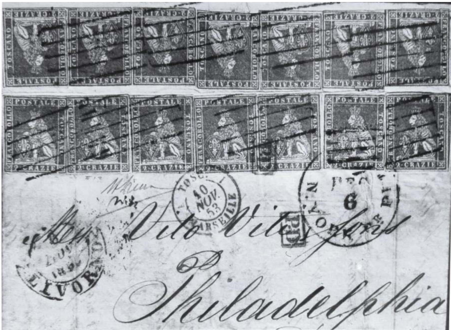
LIVORNO 8 NOVEMBRE 1853