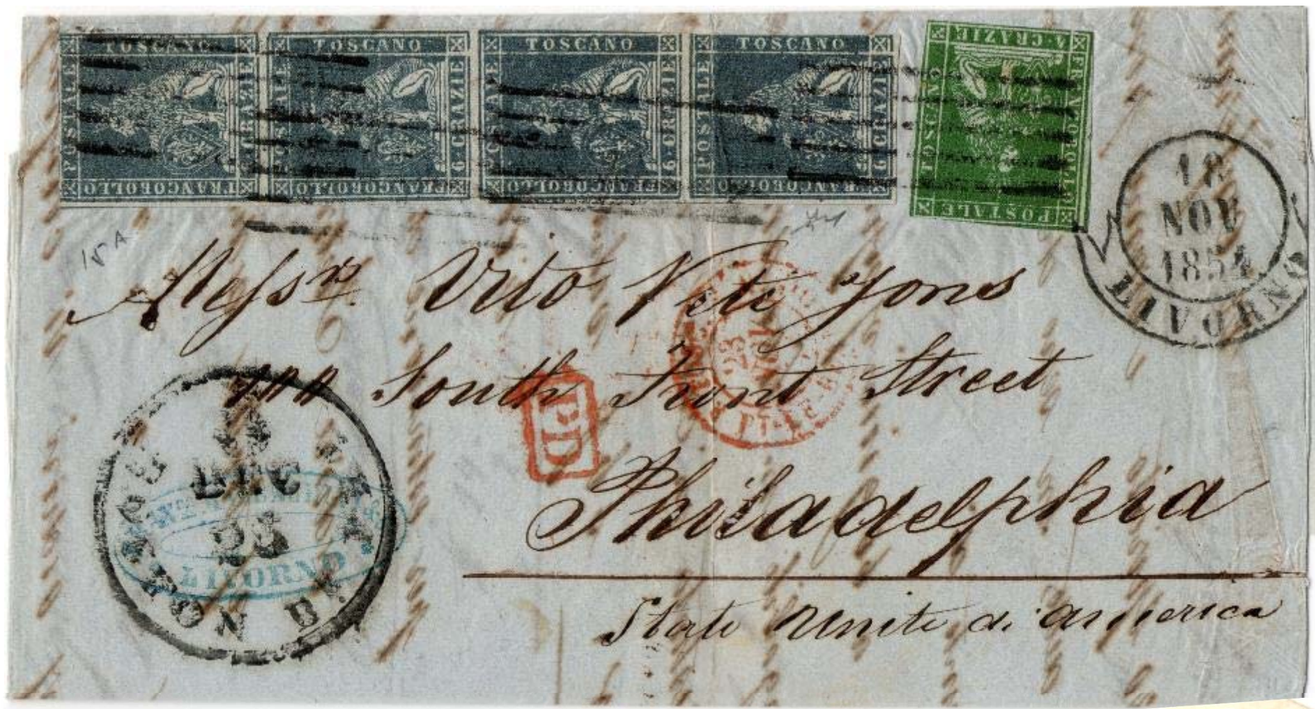
Cover posted in Leighorn on November 18, 1854 addressed to Philadelphia Prepaid 28 Crazie for Simple Rate with a rare strip of 4 of 6 Crazie blue and 4 Crazie green The "PD" red marking would mean "Paid to Destination" but is paid to the arrival Port Forwarded by way of France, Double red circle entree marking "TOSCANE Pont-DE- BEAUVOISIN-23 NOVembre 1854"- Transit "BOSTON BR PKT-DECEMBER 25-5" The 5 indicate the 5 Cents for the Domestic Rate to be paid from the addressee