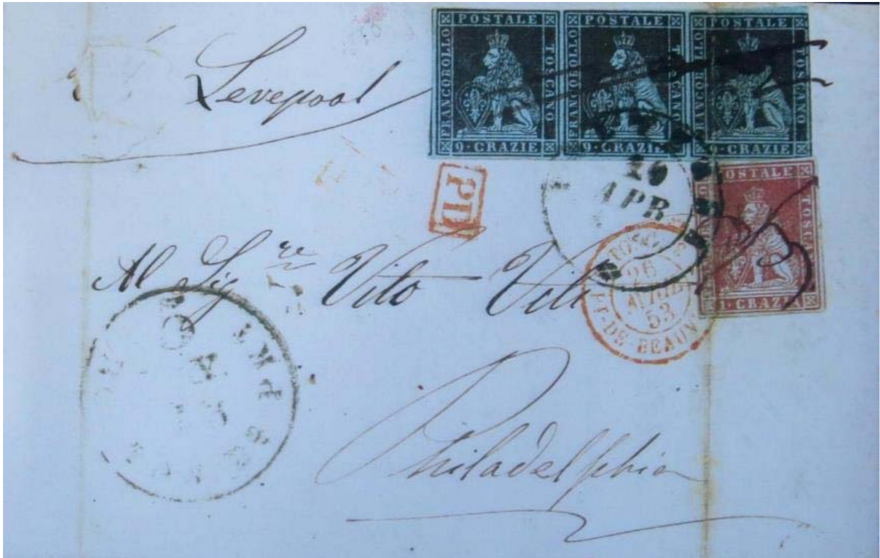
VOLTERRA 20 APRILE 1853