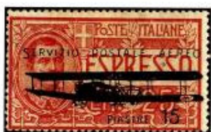
Fig. 1 – Espresso d'Italia da 25c. soprastampato "SERVIZIO POSTALE AEREO-PIASTRE 15".

Con ogni probabilità ci furono degli errori di composizione, infatti nell'unica coppia nota uno degli esemplari manca della "E" di "POSTALE" (fig. 2). A tale proposito un eccezionale documento mi è stato mostrato recentemente unitamente al permesso di pubblicarlo. È la dichiarazione di Basilio Galiani, impiegato nell'ufficio postale di Costantino-