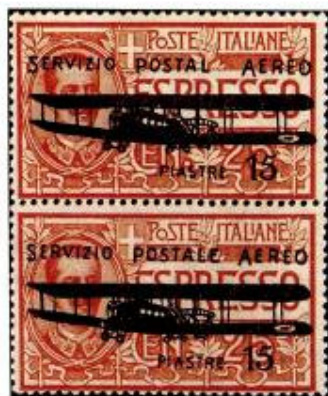
Fig. 2 – Espresso d'Italia da 25c. soprastampato "SERVIZIO POSTALE AEREO-PIASTRE 15", coppia verticale; unico multiplo tra i pochissimi es. sfuggiti alla distruzione.

poli, che dichiara autentica la coppia di francobolli in quanto "da me conservati a titolo di curiosità filatelica" (fig. 3).