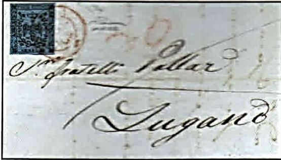
Fig. 8 - Lettera da Modena a Lugano dell' 11 giugno 1852 con cent. 40 celeste vivo annullato con bollo rosso a doppio cerchio. Fig. 8 - Letter from Modena to Lugano of 11 June 1852 with bright pale blue cent. 40 cancelled with red double circle postmark.

Di multipli annullati e non più su lettera sono noti: quattro coppie, una striscia di tre, due di cinque di cui una difettosa (Fig. 12) ed una perfetta e un blocco di sedici esemplari (Fig. 13). Su lettera è nota una coppia (Mirandola) ed alcune lettere con due esemplari (Reggio e Modena).