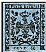
Fig.4 - L'esemplare nuovo della collezione Tapling - celeste vivo senza gomma (illustrazione autorizzata da "The British Library"). Fig.4 - The unused example from Tapling Collection - bright pale blue without gum (reproduction authorized by "The British Library").