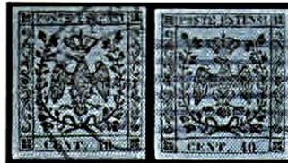
Fig. 11 - Due esemplari da cent. 40 celeste con entrambi annulli di Guastalla: nominativo e a sei sbarre (azzurre). Fig. 11 - Two pale blue cent. 40 examples both with Guastalla cancellation: nominative and six bars (azure).

only with six bars cancellation, it is not possible to establish which was the office of origin, except for Guastalla which always used azure ink (Fig. 11).