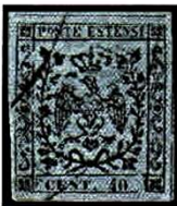
Fig. 10 - Cent. 40 celeste annullato con bollo "Raccomandata". Fig. 10 - Pale blue cent. 40 cancelled with "Registered Letter" cancellation.

Di multipli annullati e non più su lettera sono noti: quattro coppie, una striscia di tre, due di cinque di cui una difettosa (Fig. 12) ed una perfetta e un blocco di sedici esemplari (Fig. 13). Su lettera è nota una coppia (Mirandola) ed alcune lettere con due esemplari (Reggio e Modena).