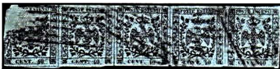
Fig. 12 - Cent. 40 azzurro - striscia di cinque esemplari (difettosa). Fig. 12 - Pale blue cent. 40 - strip of five examples (defective).

L'ultima data d'uso nota per questo francobollo è il 10 settembre 1859 (Fig. 9).