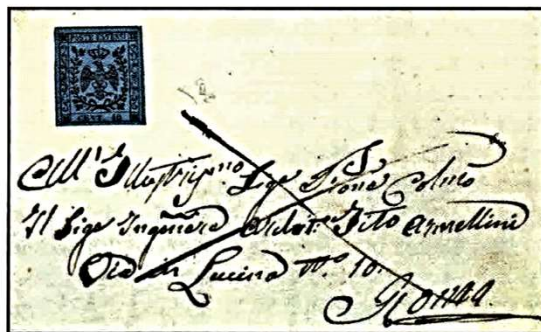
Fig.3 - Lettera affrancata con cent.40 celeste vivo e sfuggita all'annullo (Castelnovo di Garfagnana). Fig.3 - Letter franked with bright pale blue cent. 40 escaped from cancellation (Castelnovo di Garfagnana).

Like every stamp of the Poste Estensi, the 40 cent. was printed with the typographic system using black ink on machine-made paper (of poor quality) pulp coloured. The sheet was composed by 240 subjects divided into four groups of 60 (10x6) with double lines in the horizontal gutters and no lines in the vertical ones. The pale blue or bright pale blue 40 cent. was printed in 72 sheets corresponding to 17,280 stamps, while 501,600 (2,090 sheets) stamps of the same value were printed on dark blue paper (first known date: Modena, 17 October 1852). At present, no unused examples with gum coming from the first printing is recorded, even though, from the documents of the time, 372 examples appear to be returned for the change with the ones issued by the Provisional Government, on 14 October 1859, by S. Martino d'Este retailer in Rio (or S. Martino Grande). Known unused examples are without gum, only a few with partly recovered gum coming from letters with postage stamp escaped from cancellation (Fig. 3).