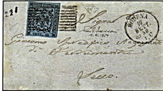
Fig. 9 - Lettera scritta da S. Martino Grande (dal testo interno) per Lecco con cent. 40 celeste vivo annullato con bollo a nove sbarre con stemma Sabauda al centro del 10 settembre 1859 (periodo di Governo Provvisorio) - ultima data nota d'uso di questo francobollo. Fig. 9 - Letter from S. Martino Grande (text inside) to Lecco with bright pale blue cent. 40 cancelled with nine bars cancellation, with Savoy coat of arms, of 10 September 1859 (Provisional Government) - last date of use known for this postage stamp.

La buona richiesta per gli esemplari nuovi senza gomma e la conseguente alta quotazione di mercato hanno destato "l'interesse" di alcuni alchimisti che con miscugli di decoloranti hanno tentato di scolorire il 40 centesimi azzurro scuro o qualche esemplare del celeste annullato debolmente con bollo rosso di Modena. È sufficiente una lampada a luce Wood anche di modeste capacità per accorgersi dei tentativi in quanto, così trattati, la rifrazio-