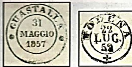
Fig.2 - Bolli di Guastalla e Modena. Fig.2 - Guastalla and Modena postmarks.